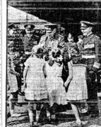
El presidente Hindenburg en Kiel, rodeado por sus escoltas.

El presidente Hindenburg llegó a Kiel para visitar a la escuadra. Fue recibido con honras. El presidente Hindenburg llegó a Kiel para visitar a la escuadra. Fue recibido con honras.