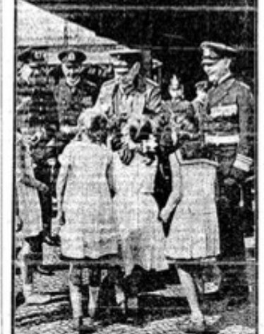
Visita de Kiel celebrada y recibida por el presidente Hindenburg, después de la celebración celebrada el día 26.