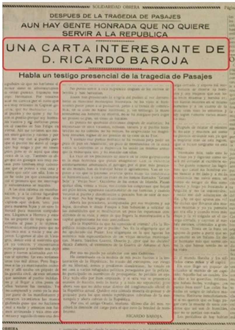
Periódico Solidaridad Obrera, 6 de junio de 1931

El 9 de junio La Gaceta publicó el laudo acordado por el Gobierno. Ante esta situación, el día siguiente, 10 de junio, los pescadores decidieron subir a los barcos y volver al trabajo. Se embarcaron el 12.