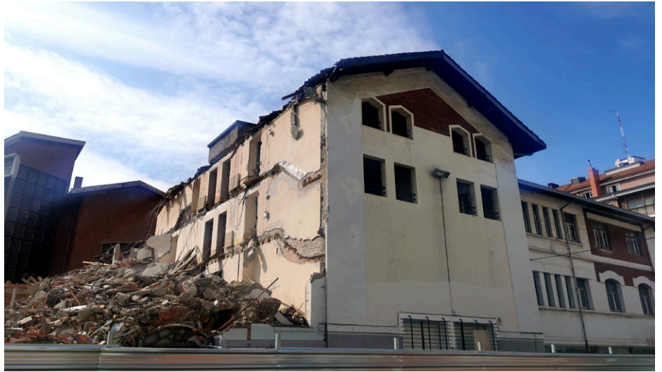
El edificio de Lope de Vega 12 formaba parte del centro histórico de Romo

El emprendimiento juvenil y el envejecimiento activo sólo les interesa mientras puedan controlarla. Les hablan de lugares alternativos que no se asemejan ni de cerca a lo que tenían y a lo que necesitan.