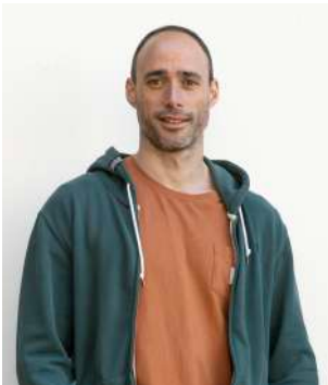
Mikel Bildosola Agirregomezkorta Ekonomian lizentziaduna. Igeriketa entrenatzailea eta munduko txapelduna